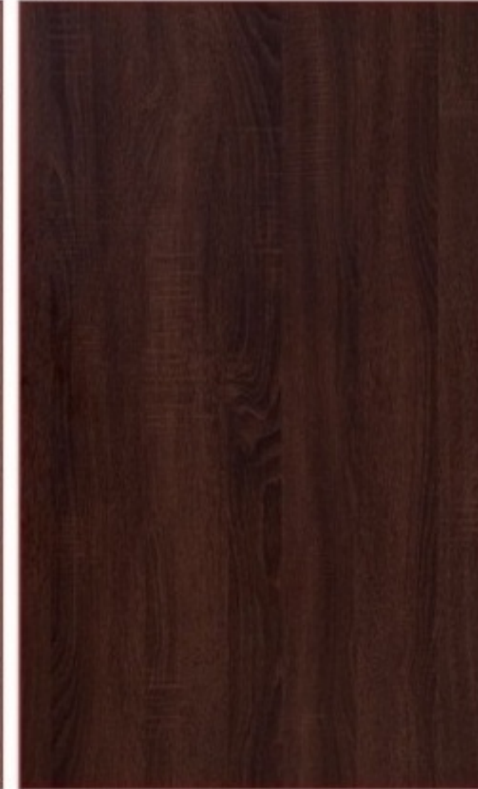
dub winchester /MDWR/